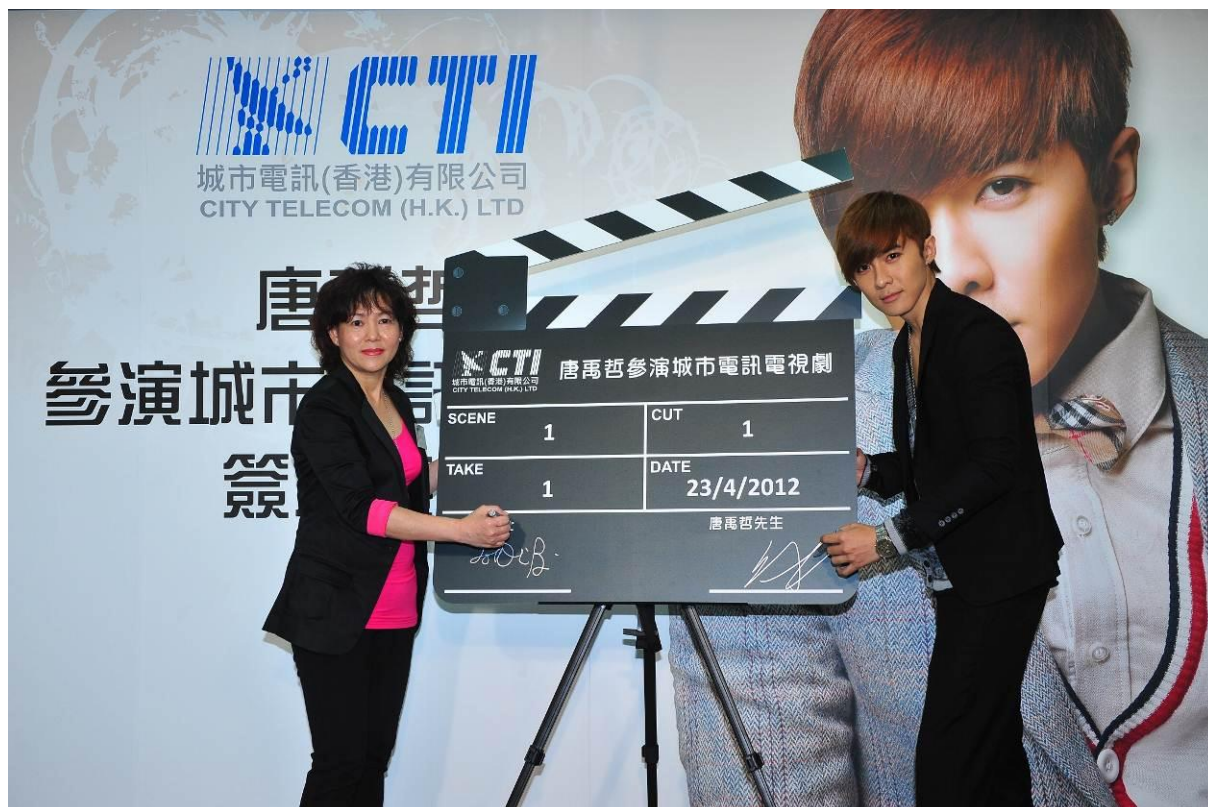
城市電訊電視部行政總裁杜惠冰女士(左)與台灣人氣偶像唐禹哲(右)進行簽約儀式，唐禹哲將來港擔綱演出城市電訊的其中一部電視劇。