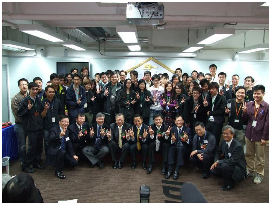
城市電訊各高層聯同香港管理專業協會代表與「下一站・大學」全體參加員工合照