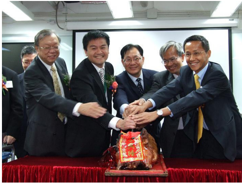
城市電訊集團行政總裁楊主光（圖右）、財務總裁及員工關顧部主管黎汝傑（圖中左二）、非執行董事李漢英（圖左）及香港管理專業協會代表切燒豬慶祝「下一站・大學」正式開學。