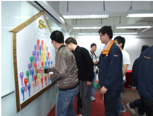
參加「下一站・大學」的城市電訊員工逐一上台把門匙放進黃金屋內，喻意「書中自有黃金屋」。