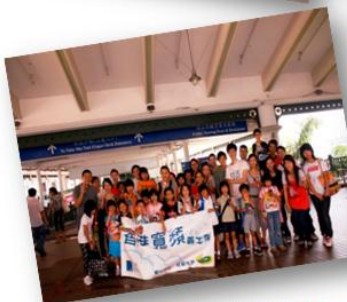
保良局兒童外展訓練