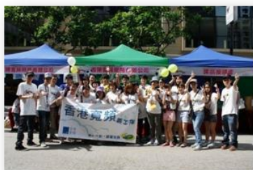
義工隊-香港及廣州