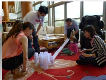
探訪麥當勞叔叔之家