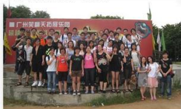
人才外展訓練-廣州