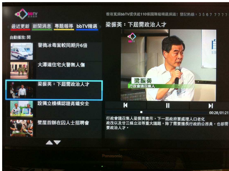
bbTV新聞台應用程式「新聞消息」介面